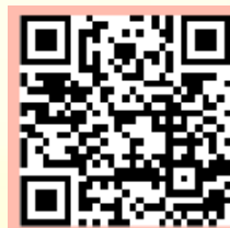
꿈꾸는 그림책 극장