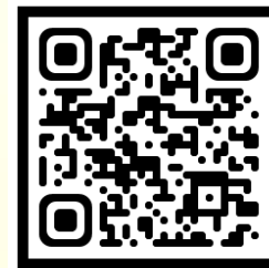
꿈꾸는 그림책 극장